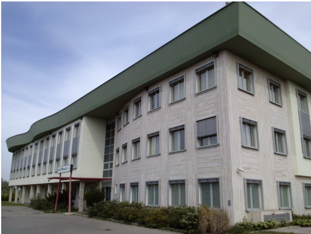
Megyeri út felőli homlokzat a Főbejárattal