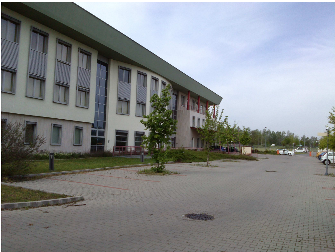
Belső udvar felőli homlokzat