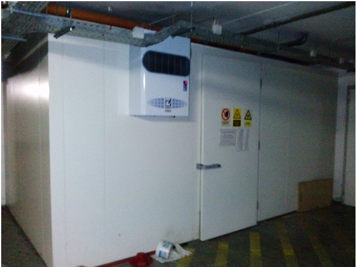
Veszélyes-anyag tároló hűtőkamra