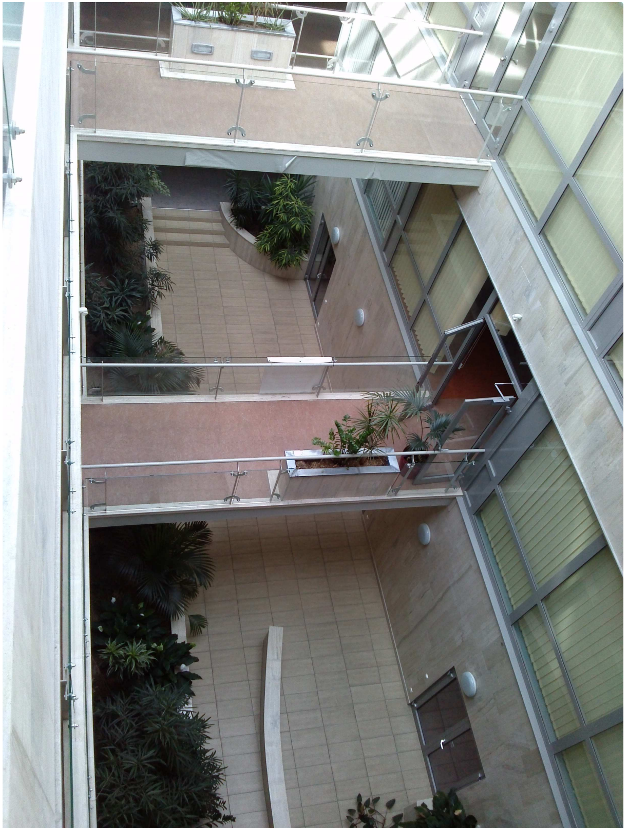
Exkluzív belső környezet